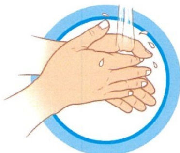
ЧАСТО МОЙТЕ РУКИ С МЫЛОМ